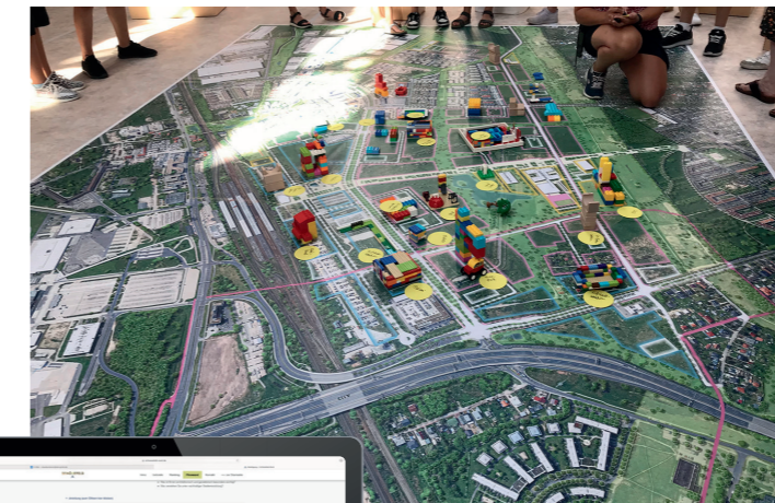
▲ Kinder- & Jugendbeteiligung: "Baue deine eigene Stadt"

▲ Ideen für das Quartier: Die acht Leitziele für Schönefeld Nord, entwickelt als Leitfaden im Rahmen einer „Charta“, sollen die Grundlage für Entscheidungen und Maßnahmen im Quartier bilden. Um sie konkret zu gestalten, waren Bürgerinnen und Bürger eingeladen, ihre Ideen, Hinweise und Anmerkungen auf einer virtuellen Flipchart zu pinnen und so aktiv an der Entwicklung des neuen Quartiers mitzuwirken.