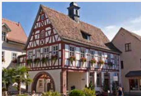
Schriesheim / Baden-Württemberg