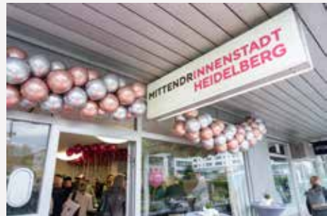
Heidelberg / Baden-Württemberg