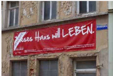
Naumburg (Saale) / Sachsen-Anhalt