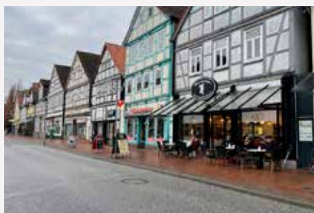
Burgdorf / Niedersachsen