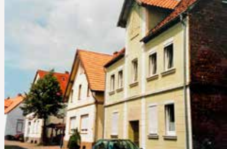
Horn / Nordrhein-Westfalen