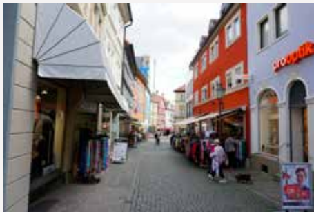
Kitzingen / Bayern