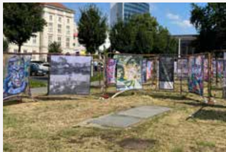
Cottbus / Brandenburg