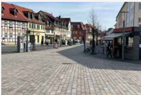
Sömmerda / Thüringen