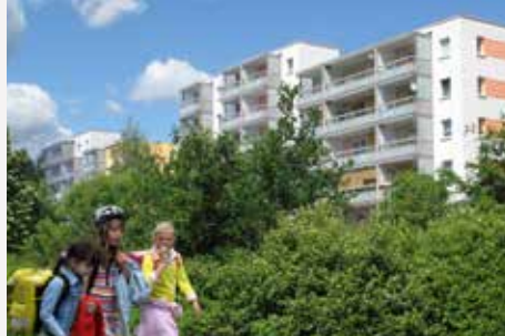
Bad Salzungen / Thüringen