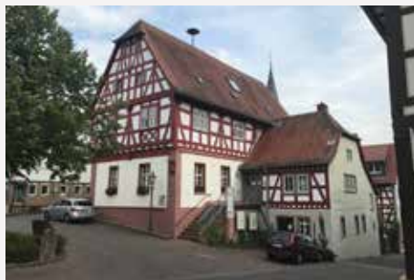
Reichelsheim / Hessen