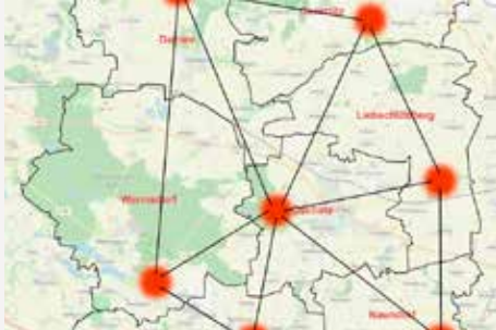
Oschatzer Land / Sachsen