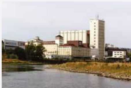
Riesa / Sachsen