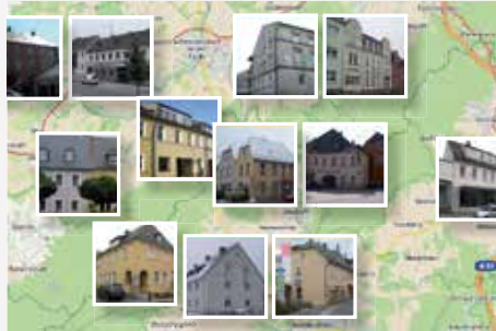
Allianz Nördliches Fichtelgebirge / Bayern