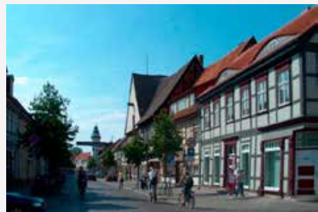
Salzwedel / Sachsen-Anhalt