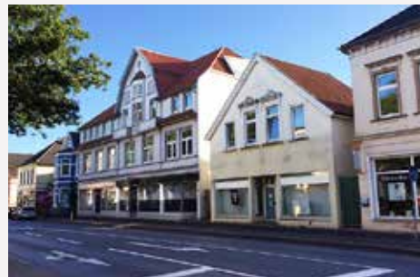
Oldenburg / Niedersachsen