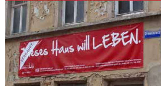
Naumburg (Saale) (Sachsen-Anhalt)