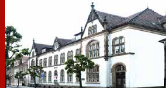
Mecklenburgische Seenplatte (Mecklenburg-Vorp.)