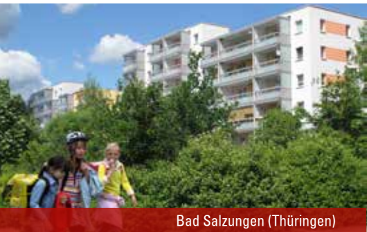
Bad Salzungen (Thüringen)