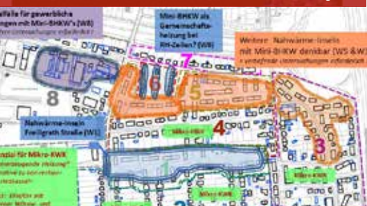
Langenhagen Wiesenau (Niedersachsen)