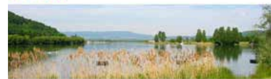
Mittleres Werratal (Hessen)