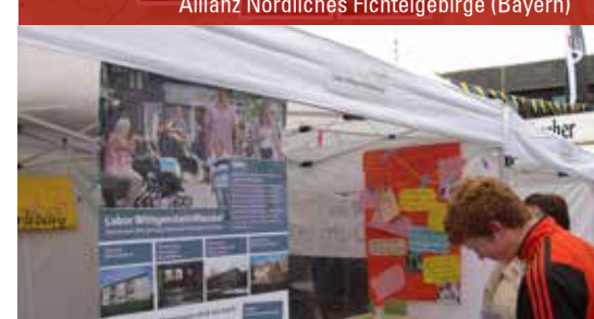
Region Wittgenstein (Nordrhein-Westfalen)