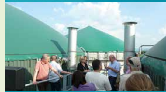
Landkreis Gotha, Thüringen