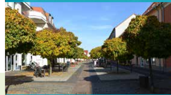
Fürstenberg (Havel), Brandenburg