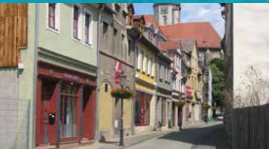
Naumburg (Saale), Sachsen-Anhalt