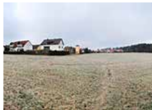
Petersaurach | Bayern Energetisches Quartierskonzept/ Energetisches Sanierungsmanagement