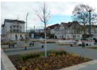
Bad Salzungen | Thüringen Energetisches Quartierskonzept/ Energetisches Sanierungsmanagement „Bahnhofsareal“