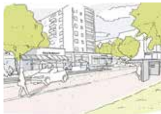
Kerpen | Nordrhein-Westfalen Erstellung eines umfassenden energetischen Quartierskonzepts Europaviertel – Kerpen Nord