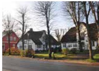
Föhr | Schleswig-Holstein Gesamtenergieplanung Föhr und Amrum/Energetisches Sanierungsmanagement

Unser Klima-Fachteam betreut Projekte in über 100 Kommunen deutschlandweit. Hier eine Auswahl unserer Referenzen