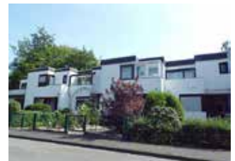
Gütersloh | Nordrhein-Westfalen KlimaQuartiere „Englische Straße“, „Franckestraße/Comeniusstraße“ und „Töpferstraße“, „Am Anger/Sundernstraße“, „Blankenhagen“ und „Mielesiedlung“