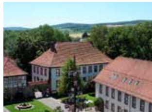
Moringen | Niedersachsen Energetisches Quartierskonzept/ Energetisches Sanierungsmanagement/ Urbane Dekarbonisierung durch ein Nahwärmenetz