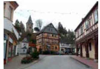
Weilmünster | Hessen Integriertes Energetisches Quartierskonzept Stadtkern