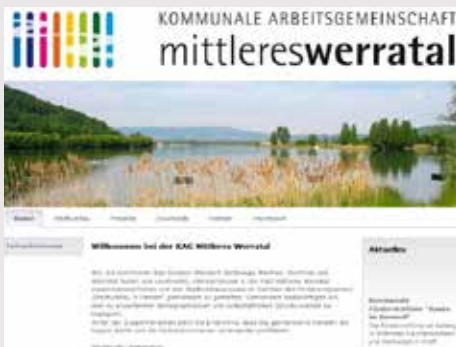
Mittleres Werratal / Hessen