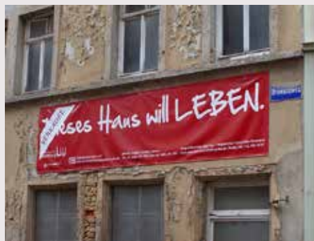
Naumburg (Saale) / Sachsen-Anhalt