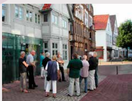
Lemgo / Nordrhein-Westfalen