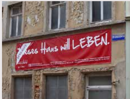
Naumburg (Saale) / Sachsen-Anhalt