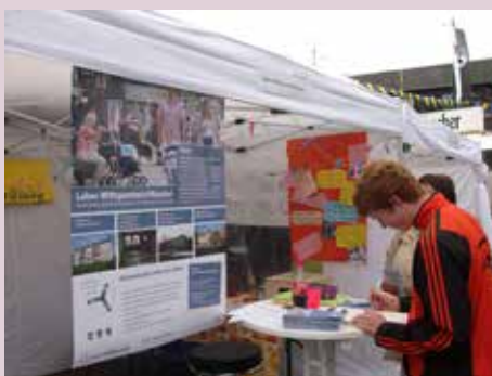
Region Wittgenstein / Nordrhein-Westfalen