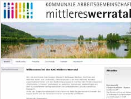
Mittleres Werratal / Hessen