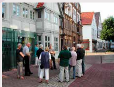
Lemgo / Nordrhein-Westfalen