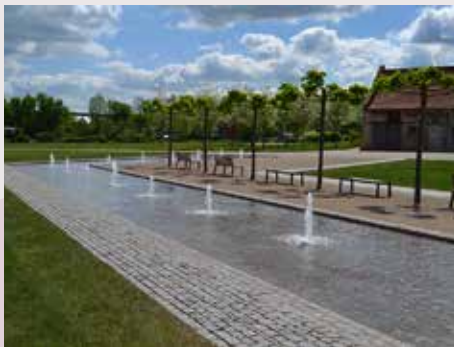
Ohrdruf / Thüringen