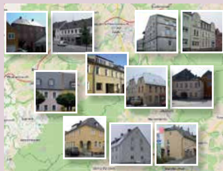
Allianz Nördliches Fichtelgebirge / Bayern