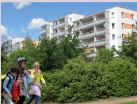
Bad Salzungen / Thüringen